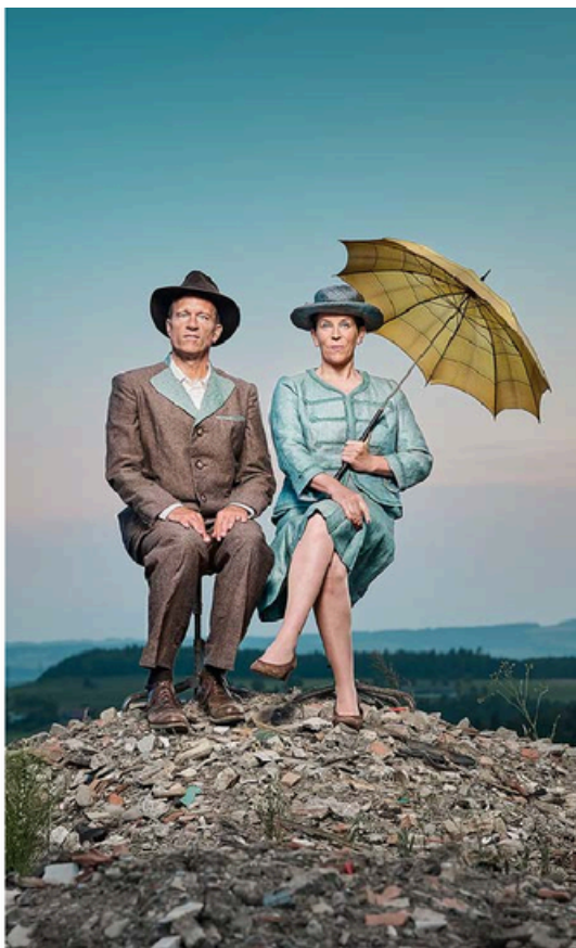
Geistreiche Satire garantiert: Kabarettduo schön&gut